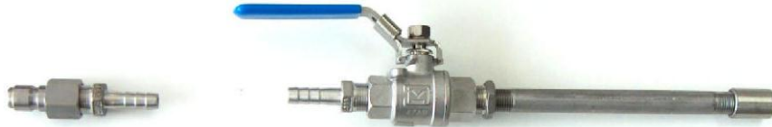
Lance & robinet à tournant sphérique pour assainisseur en acier inoxydable