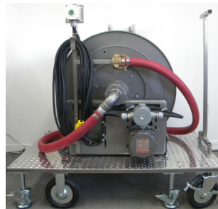
Station avec boyau de 1-1/2''

Entièrement configurable, la station portative peut être fabriquée pour contenir un boyau de 1/2'' (13 mm) jusqu'à 2'' (51 mm) selon les besoins.