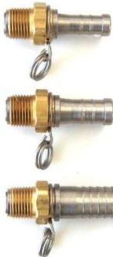
Pièce # 21S – Adaptateur pivotant

Pivotant – 1/2, 5/8, 3/4" (12.7, 15.9, 19 mm) D.I. boyau (pour pistolet économiseur d'eau)