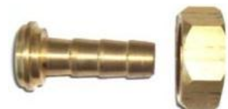
Pièce # 22

Grandeur disponible : 1/2, 5/8, 3/4" (12.7, 15.9, 19 mm)